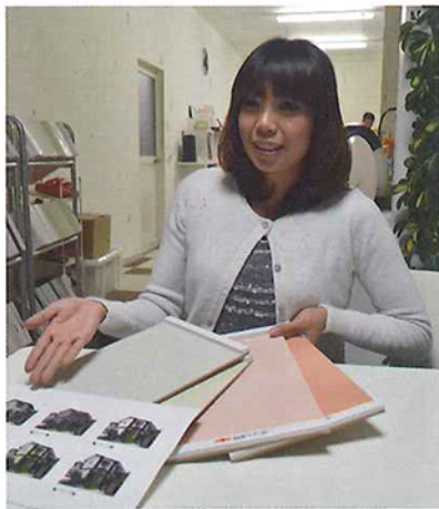
児玉塗装 愛知県名古屋市

そこで同社では、カラー確定書という用紙を作成。色が確定した後に、印鑑を押してもらう。このやり取りを行うことで、色選びに関する責任を一方的に押し付けられることが減ったという。